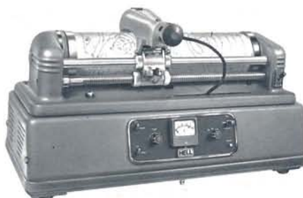
Hellfax Wetterkartensender WF 104