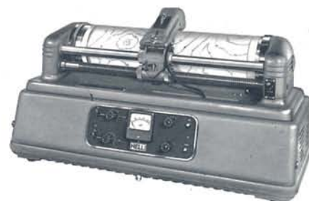
Hellfax Wetterkartenempfänger WF 103