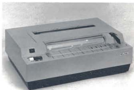
Moderne Hellfaxtechnik Fernkopiergerät HF 1048 für Bürobetrieb