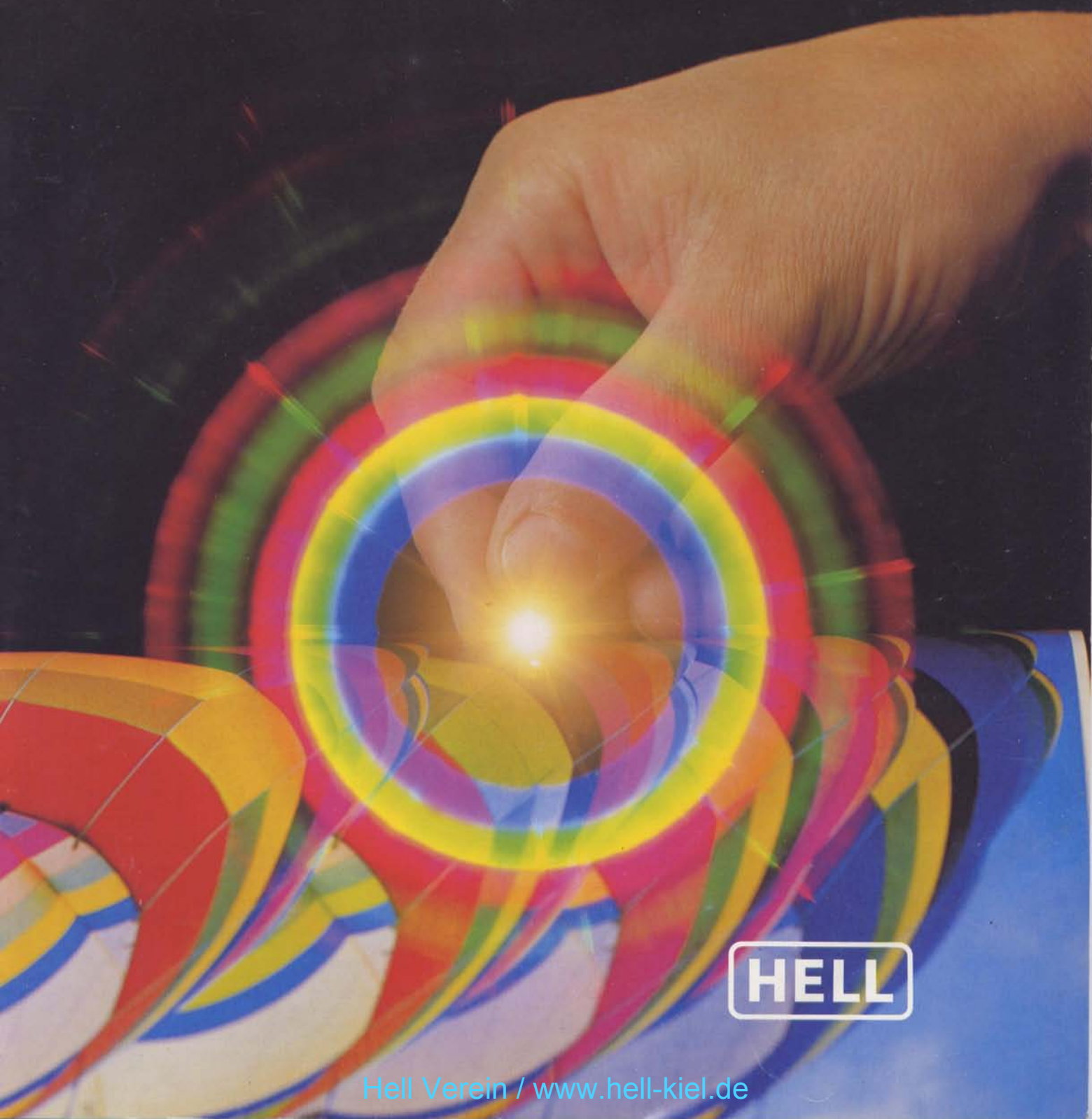
Bild und Schrift mit HELL-Technik