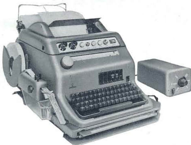
PERFOGRAPH T typ 101

Pausenlos treffen bei Tag und Nacht Nachrichten aus allen Teilen der Welt und bestimmt für alle Ressorts im Fernschreibraum einer Tageszeitung ein. Sie werden verteilt, redaktionell verarbeitet, redigiert, geschrieben und gehen als Manuskript an die Setzmaschine. Oder: Sonderseiten wie Modebeilagen, Forschung und Wissen, Reisetips, also Seiten mit neutraler aber doch aktueller Themenstellung, gehen zum Vorsatz. Dies alles sind, wenn man es richtig betrachtet, kleine Berge von Manuskripten, Tausende von Zeilen, Hunderttausende von Buchstaben, die dem Maschinensetzer Tag für Tag zur Weiterverarbeitung